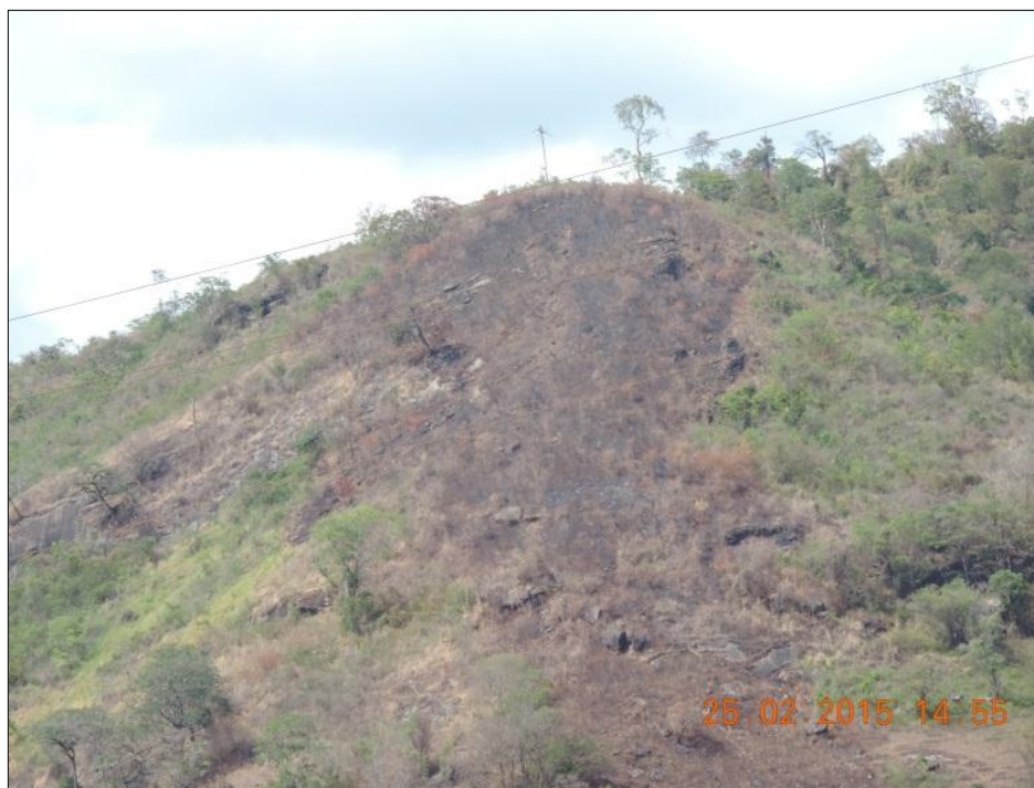
Visão aproximada da vegetação queimada.