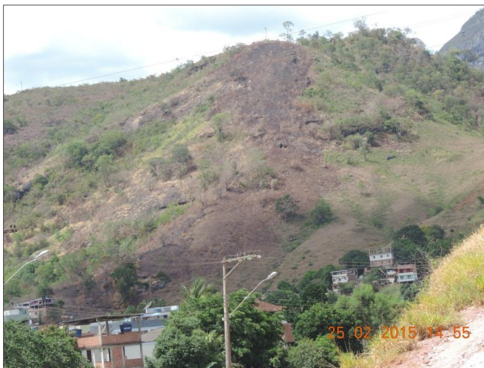
Visão frontal da área incendiada.